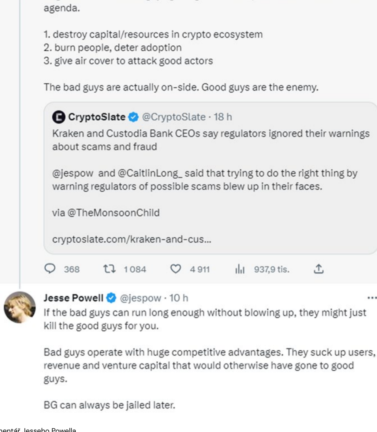
Komentář Jesseho Powella

■ Žaloby a nátlak na tvůrce dolarových stablecoinů. Například 13. února obdržela společnost Paxos oznámení od SEC, ve kterém jí nařizuje, aby přestala razit stablecoin BUSD, dokud se nevyřeší nesrovnalosti.